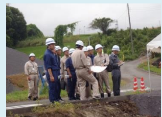
ごみ処理施設建設特別委員会による現地確認

工事の状況だけでなく、環境監視（大気、騒音、振動）を行っていくことを説明し、測定地点の状況も確認してもらいました。