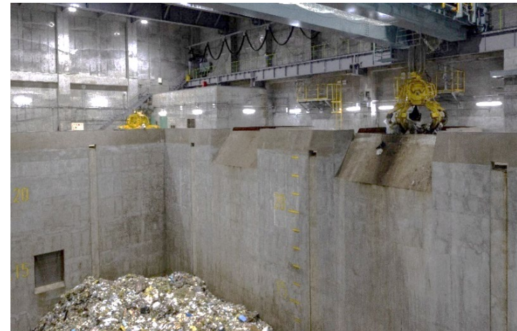
ごみ投入ホッパーは焼却炉の入口です。1時間に2～3回程度、よく混ぜて均一になったごみを焼却炉に投入しています。