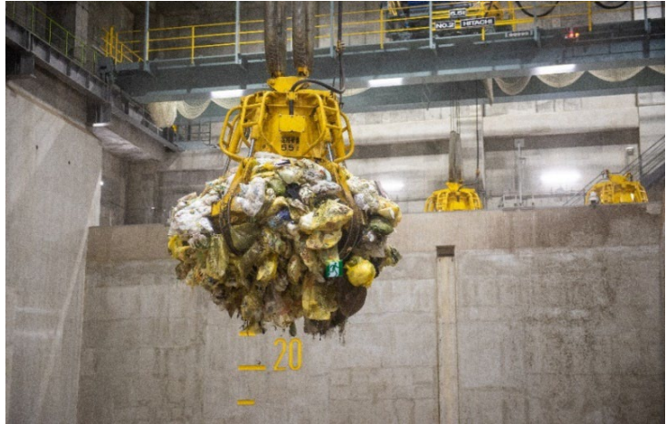
ごみクレーンは、ごみピットのごみをつかんで移動させます。一度に5.5トンの重さまでもちあげることができます。