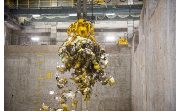
ごみを一度つかみあげてから落とす、攪拌とよばれるごみを混ぜる作業をしています。ごみをよく混ぜることで、均一な状態にしています。